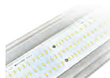
Hervorragende Wärmeableitung durch Aluminium-Leiterplatte

Geschlossenes und wasserdichtes Gehäuse (IP65), erlaubt die Reinigung mit Hochdruck