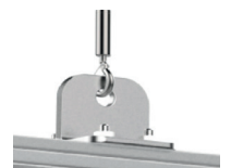
Einfache Installation, stark und zuverlässig